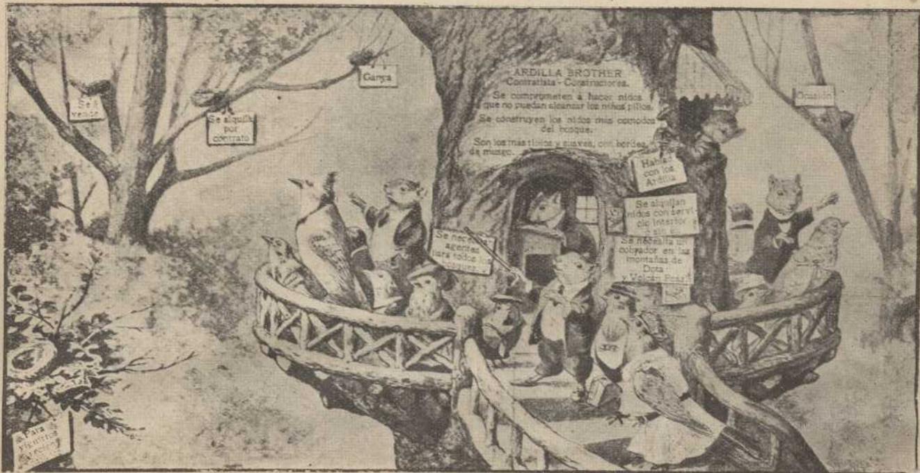
Este documento es propiedad de la Biblioteca Nacional "Miguel Obregón Lizano" del Sistema Nacional de Bibliotecas del Ministerio de Cultura y Juventud, Costa Rica.